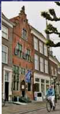
'De Roos': museum en VVV

Of dat nu museum De Roos is in Geertruidenberg, waar op fraaie wijze in vele facetten de geschiedenis van leven en werken in Hollands oudste stad te zien is, of landgoed Het Broeck in Raamsdonk met Rijtuig Museum De Koetserij, een eigen restauratieatelier, maar ook binnen- en buitenexpositie van kunstvoorwerpen en een verrassend Pelsorgel.