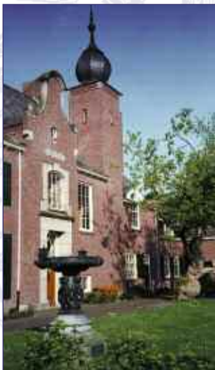
gemeentehuis te Raamsdonksveer

In de gemeente Geertruidenberg zijn de afstanden klein. Over de eigentijdse fiets- en voetgangersbrug die de rivier De Donge, de poort naar de Biesbosch, overspant, staat u aan de rand van het centrum van het gemoedelijke en gezellige Raamsdonksveer. Een dynamisch dorp met beeldbepalende panden en resten uit het verleden rondom de Haven en het Heereplein. Met fort Lunette en de uit 1890 daterende stellingkorenmolen De Onvermoeide die een bezoek meer dan waard is.