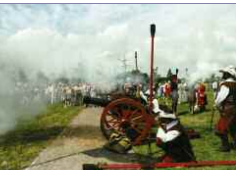
kanongebulder en kruiddampen

U komt nooit tevergeefs naar Geertruidenberg. U vindt er een scala aan activiteiten en mogelijkheden. Evenementen om van te genieten. Actief of passief recreëren. Dat kan zowel in Geertruidenberg, Raamsdonk als Raamsdonksveer.