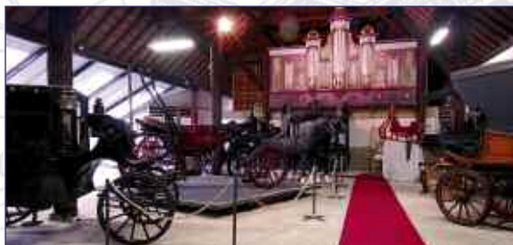
Rijtuig Museum De Koetserij

De stichting Veers Erfgoed laat in het Fruithuisje het interessante verleden van Raamsdonksveer weer tot leven komen. U valt van de ene verbazing in de andere. Proef het verleden ook in een van de oudste kerken van Brabant, de fraai gerestaureerde Lambertuskerk, parel in het landschap van Raamsdonk, of laat u meenemen door het 14e-eeuwse monument de Geertruidskerk op de historische Markt van Geertruidenberg. De kerk werd begin jaren negentig van de vorige eeuw in volle glorie gerestaureerd. Als u het aandurft, beklim dan de oude toren om eenmaal boven te worden getrakteerd op een weidse blik over de vestingstad en omgeving.