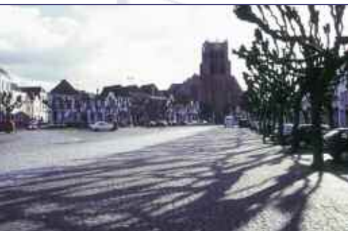
Markt en Geertruidkerk

Gemeentebestuur, VVV - agentschap, ondernemers en inwoners heten u graag van harte welkom.